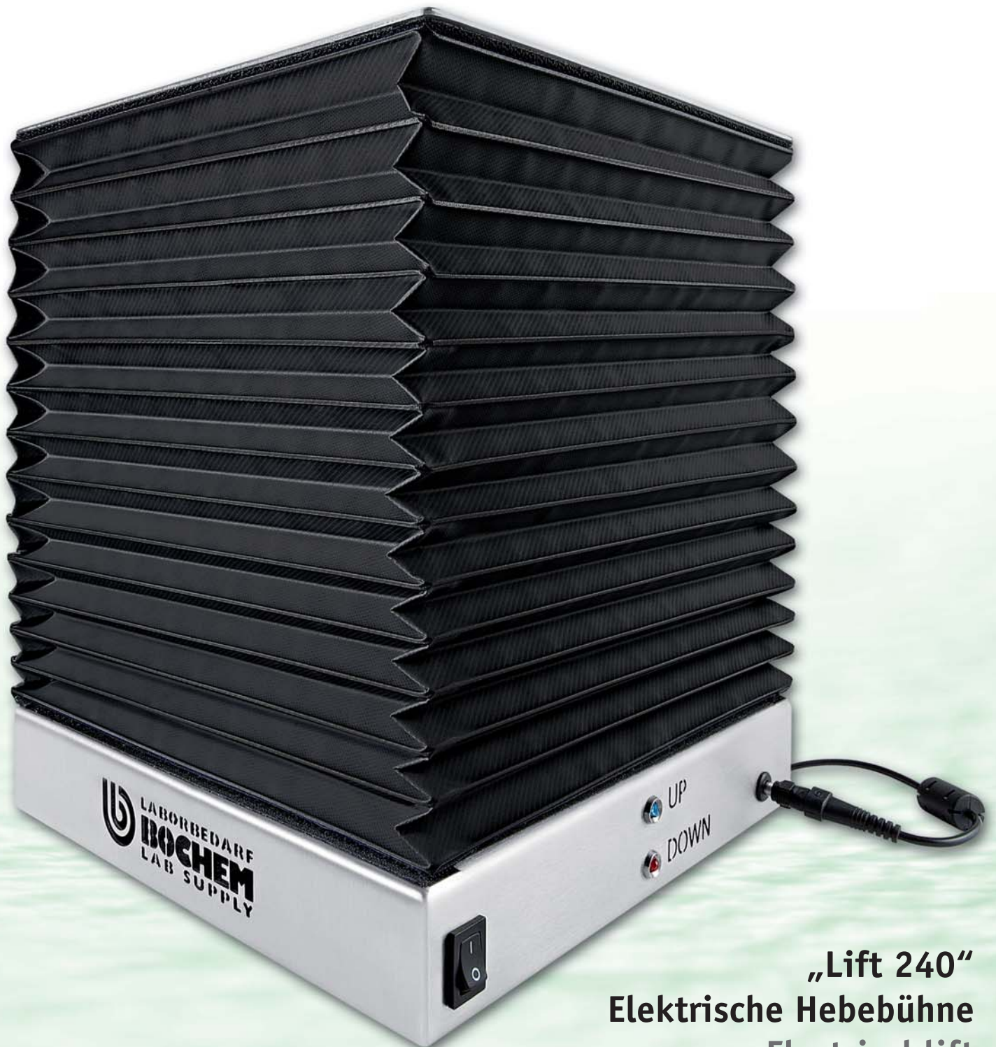
„Lift 240“ Elektrische Hebebühne Electrical lift

Kompakt. Sicher. Leistungsstark. Compact. Safe. Powerful.